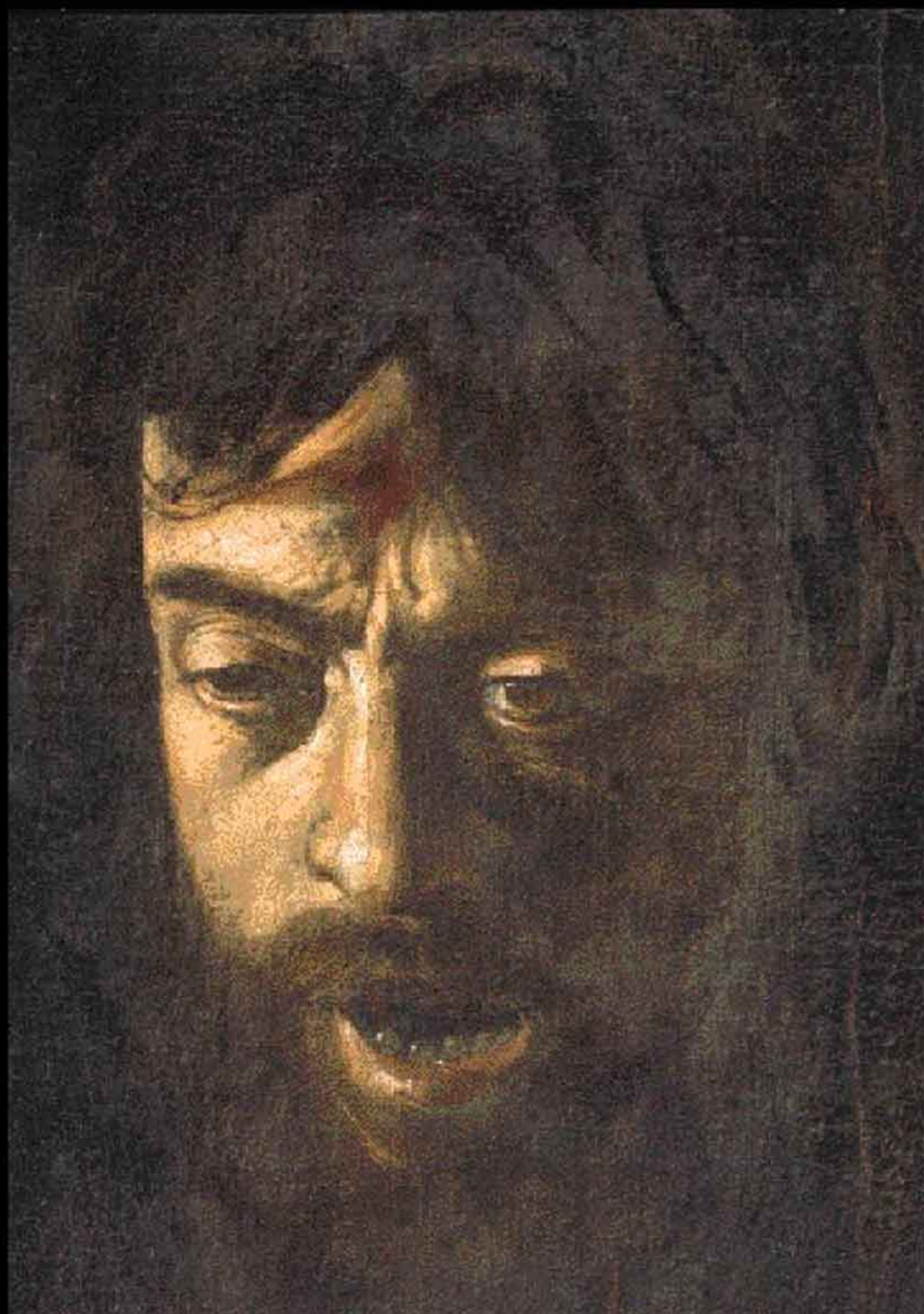
DAVIDE CON LA TESTA DI GOLIA particolare della testa di Golia