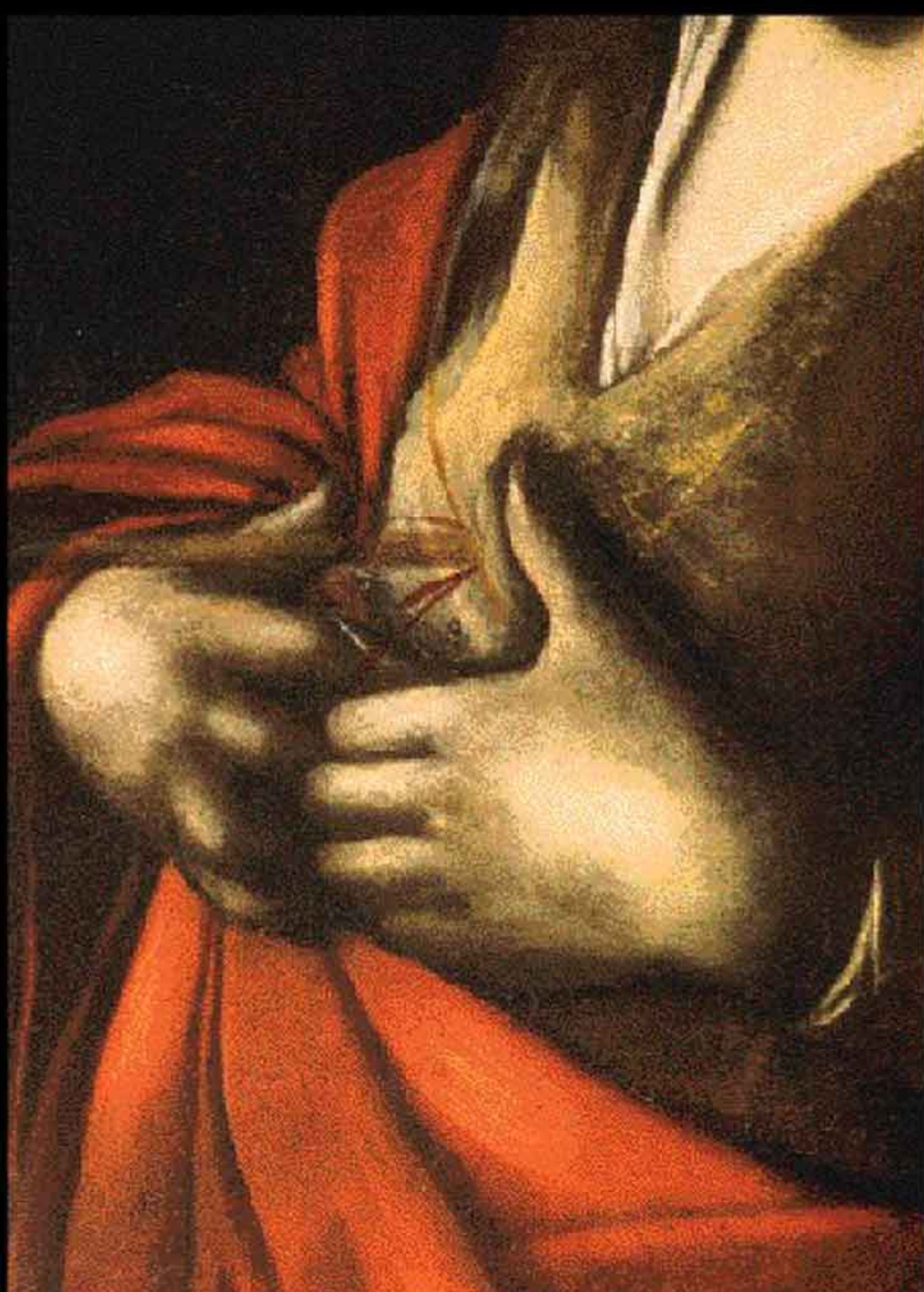
MARTIRIO DI SANT'ORSOLA particolare