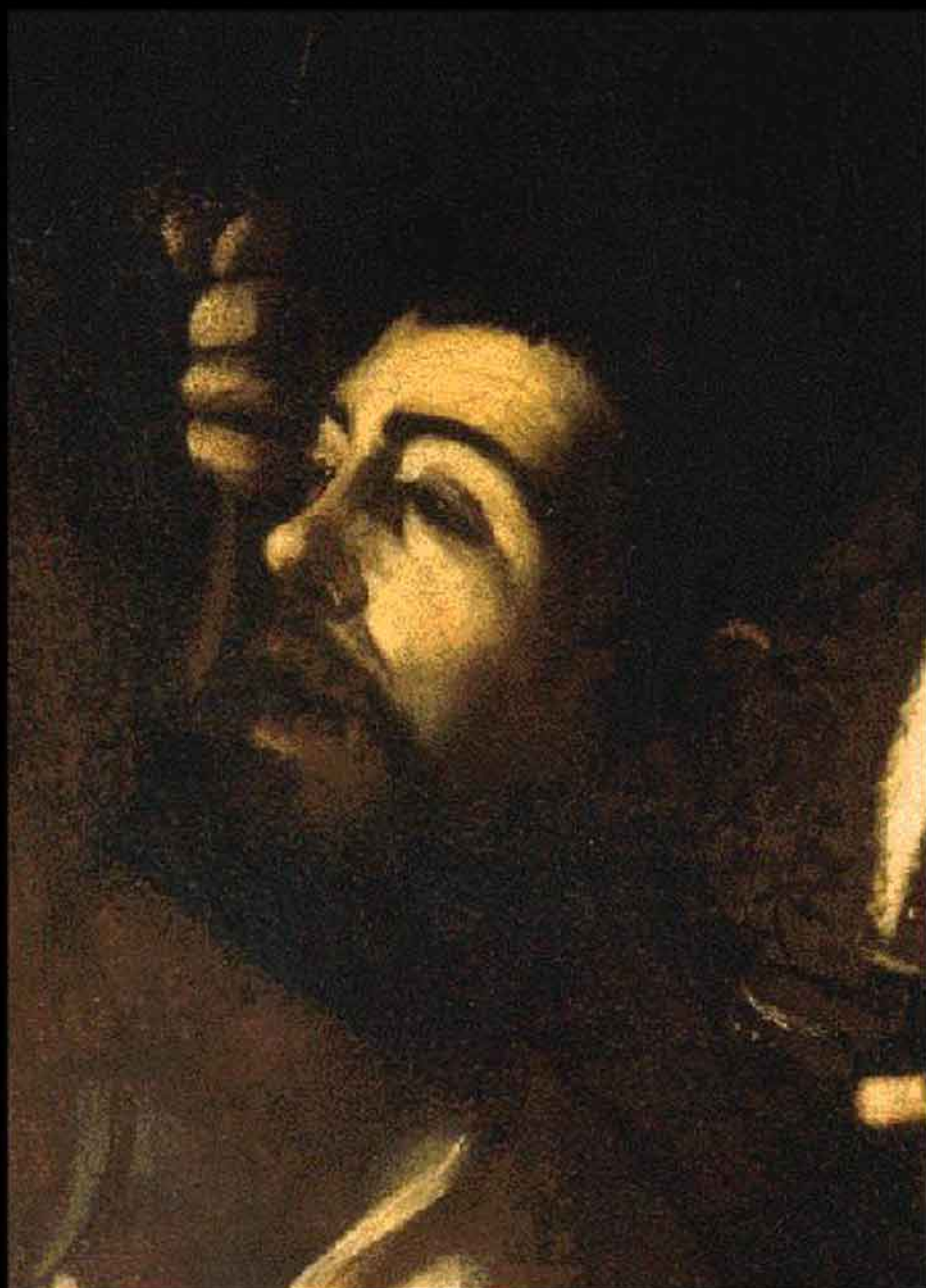
MARTIRIO DI SANT'ORSOLA particolare