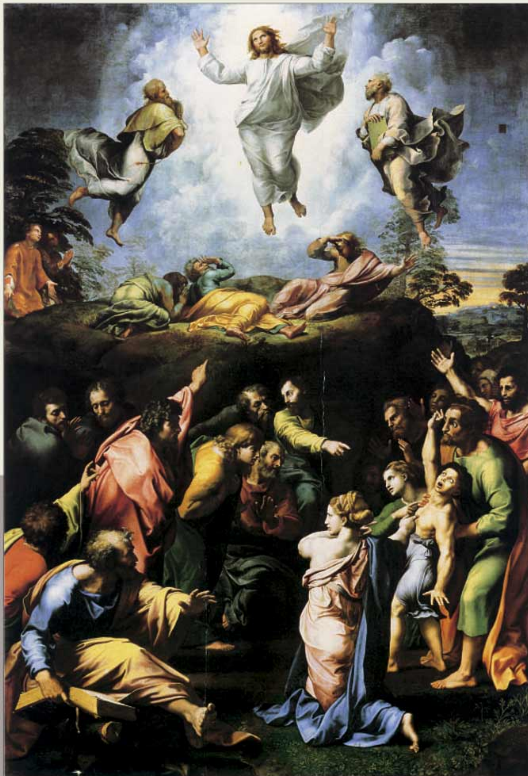
La Trasfigurazione di Cristo (1518-1520)