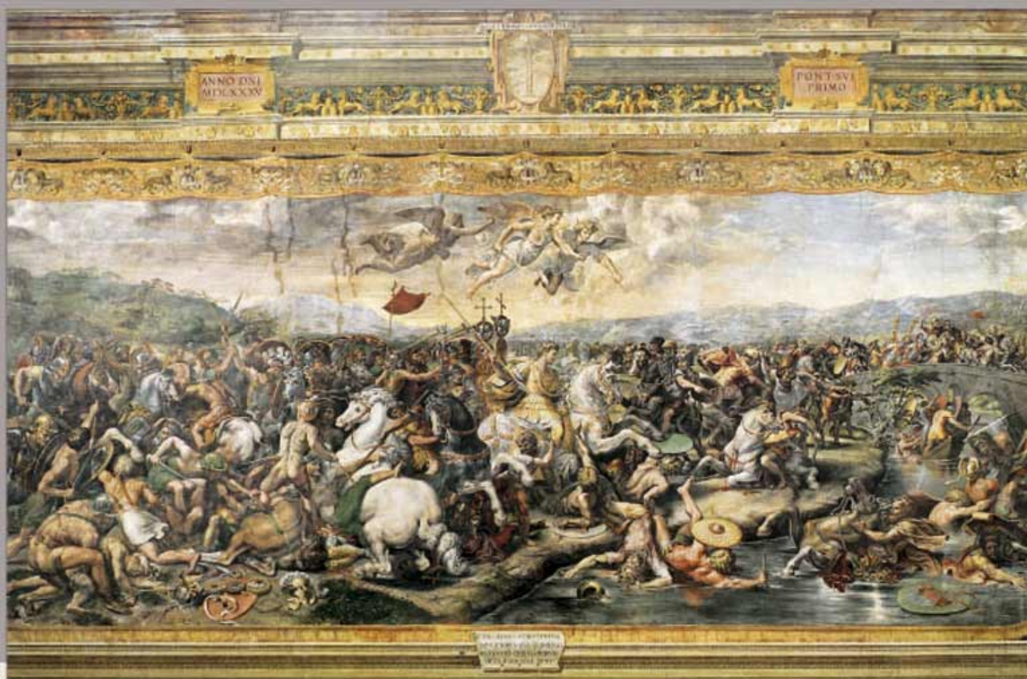
La battaglia di Costantino al Ponte Milvio (dopo il 1516) Affresco. Palazzi Vaticani