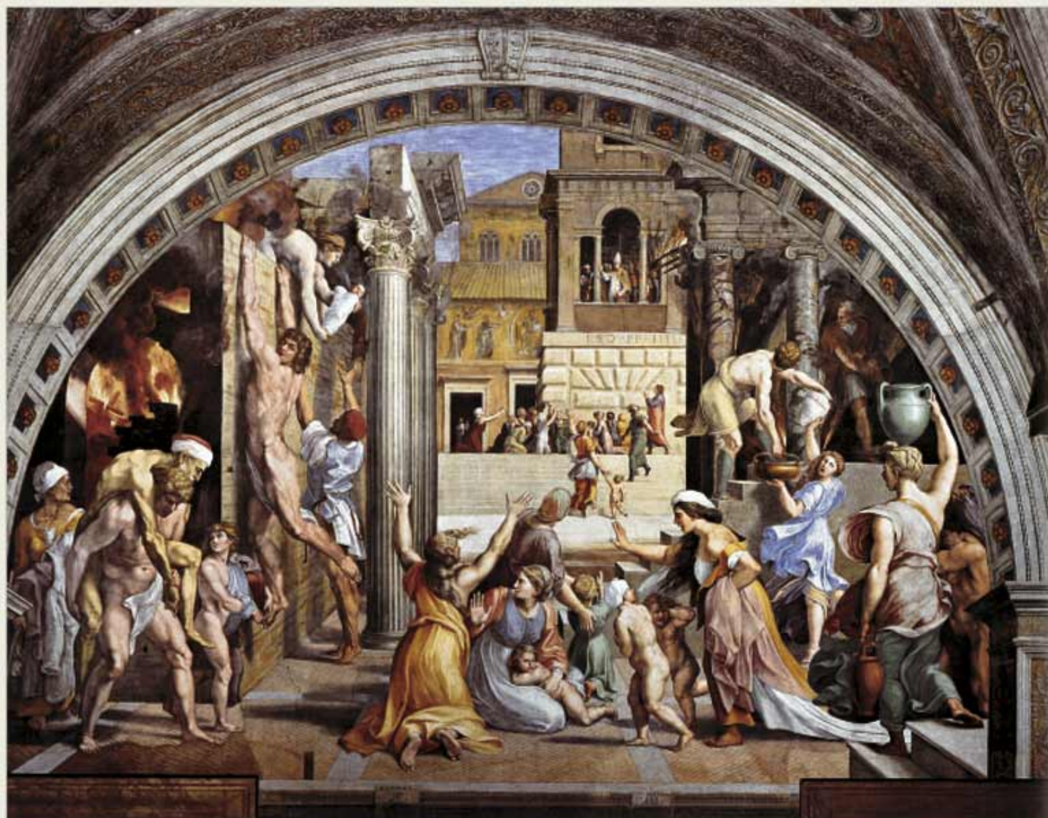
Incendio del Borgo (dopo il 1514) Affresco. Base 670 cm Palazzi Vaticani