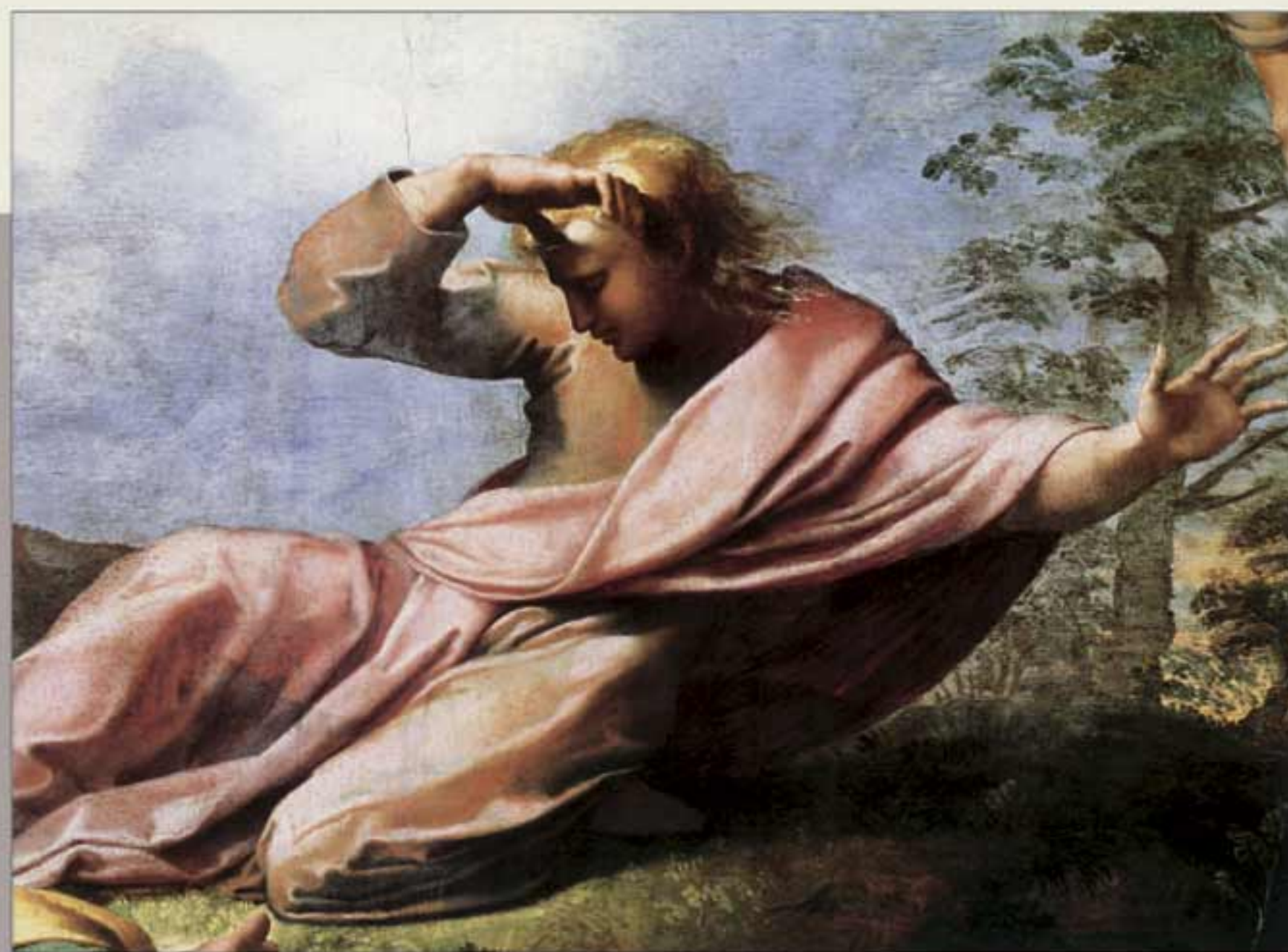
La Trasfigurazione di Cristo (1518-1520)

In tal senso sono il bagliore che si leva dietro le figure di Cristo e dei profeti, entrando in contrasto con la massa scura del rilievo erboso, e la luce che colpisce i protagonisti, evidenziandoli nella loro statuaria perfezione, a orchestrare liberamente i singoli ruoli, senza ridurre l'individualità di ciascuna comparsa.